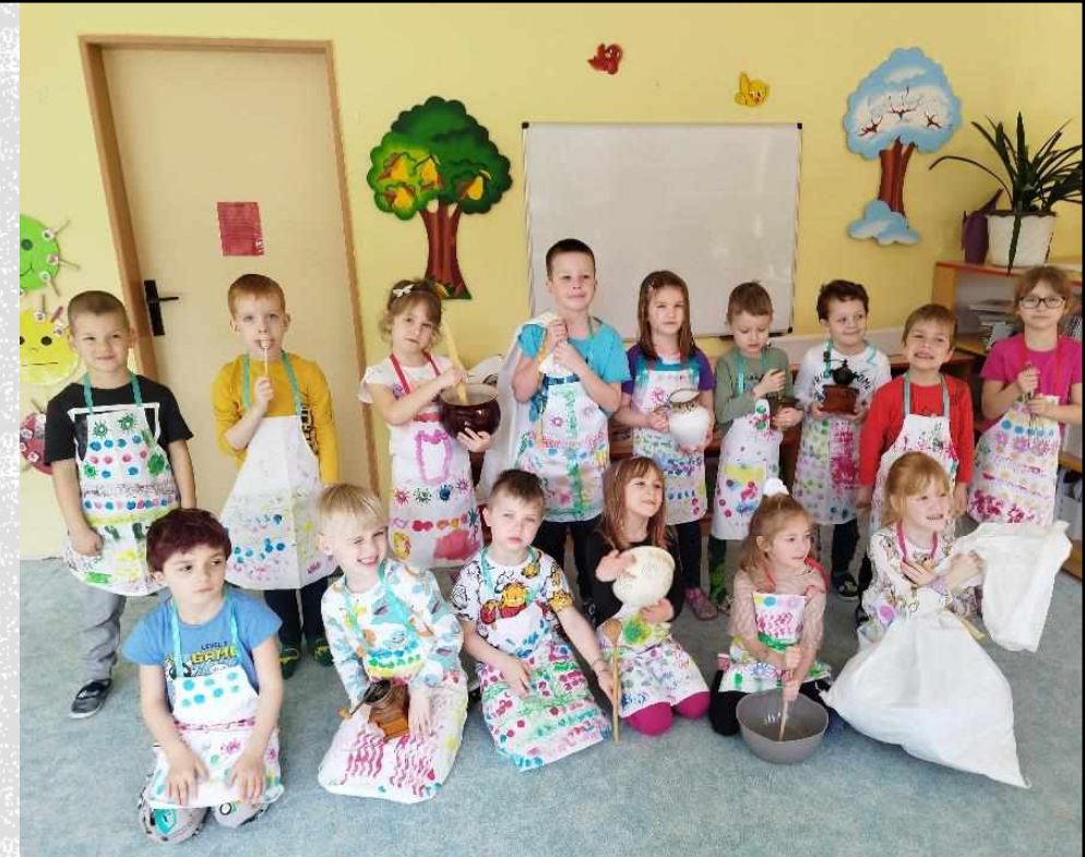
Zapomenuté řemeslo – MLYNÁŘ – MŠ Sívova