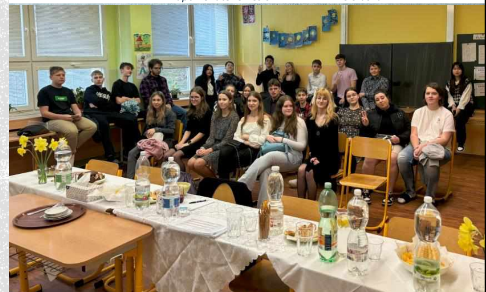
Obhajoby absolventských prací, ZŠ Bílina Aléská, ZŠ Za Chlumem